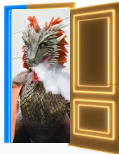
I M ZEICHEN DER DRACHEN