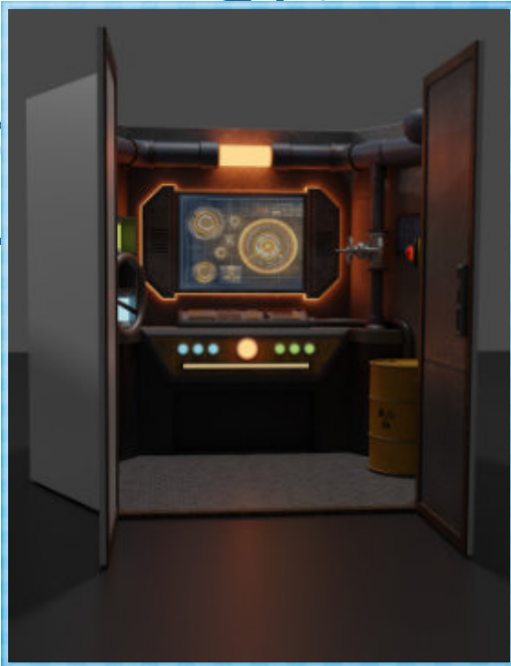
Single Room Großansicht