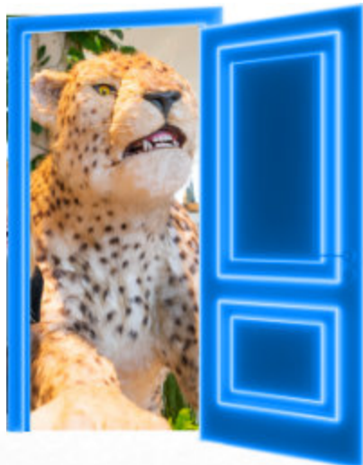
A FRICA'S BIG 5